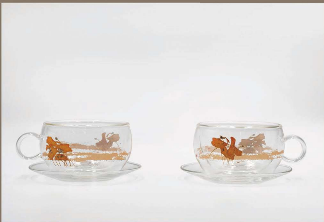
常玉 雙層咖啡杯組 荷花