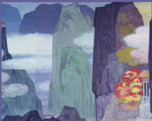
馬白水《太魯閣之美》(館藏編號 89-00684)

馬白水(1909-2003)，為臺灣水彩畫發展中本土化與中西融合的代表藝術家。此作是馬白水為90歲回顧展傾注心力之作，尺幅浩大。24聯幅水彩表現《太魯閣之美》以彩墨紀錄臺灣太魯閣之風情面貌，各幅畫作可獨觀亦可共賞提供觀者新的視覺經驗。