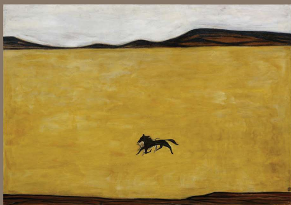
常玉《馬》( 館藏編號 26883 )

旅法藝術家常玉(1895-1966)作品融合中西藝術特色，經常利用簡潔有力的線條、造形與輪廓呈現獨特的個人風格，「裸女、植物花卉、有動物的風景」為其三大創作主題，繪畫造形簡練、色彩單純。「馬」是常玉畫作中經常出現的動物。此作常玉採用大、小的對比方式，使得作品隱約透露出一絲絲的空虛寂寞。