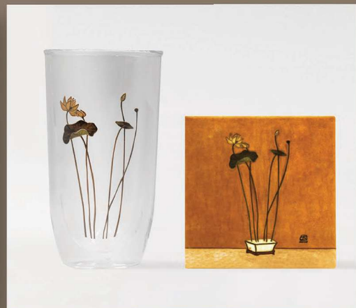
常玉 雙層玻璃杯 杯墊 荷直