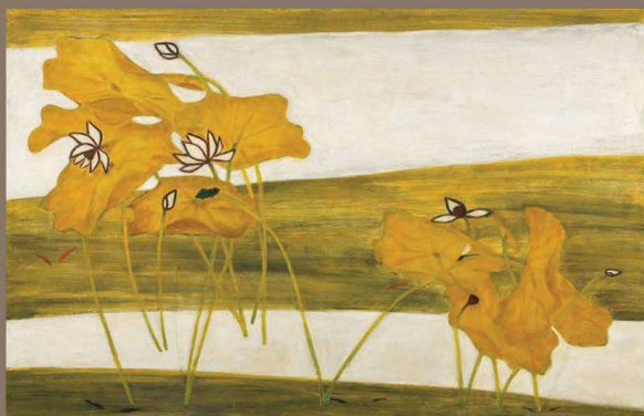
常玉《荷花》( 館藏編號 26897 )

旅法藝術家常玉(1895-1966)作品融合中西藝術特色，經常利用簡潔有力的線條、造形與輪廓呈現獨特的個人風格，「裸女、植物花卉、有動物的風景」為其三大創作主題，繪畫造形簡練、色彩單純。「馬」是常玉畫作中經常出現的動物。此作常玉採用大、小的對比方式，使得作品隱約透露出一絲絲的空虛寂寞。