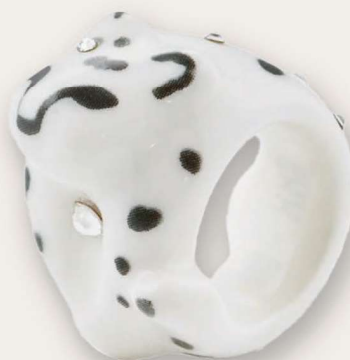
常玉雍豹戒指、雍豹戒指 (笑)