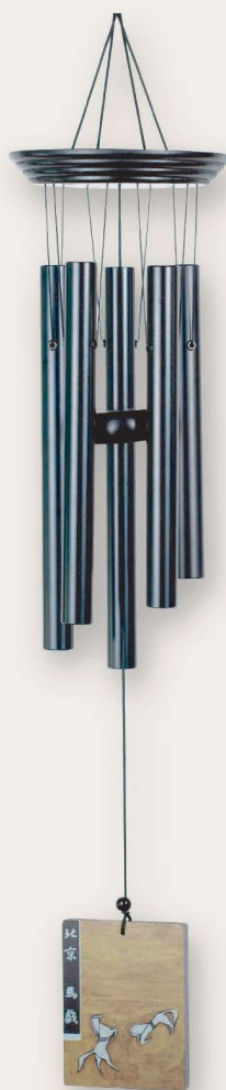
常玉風鈴 (北京馬戲)