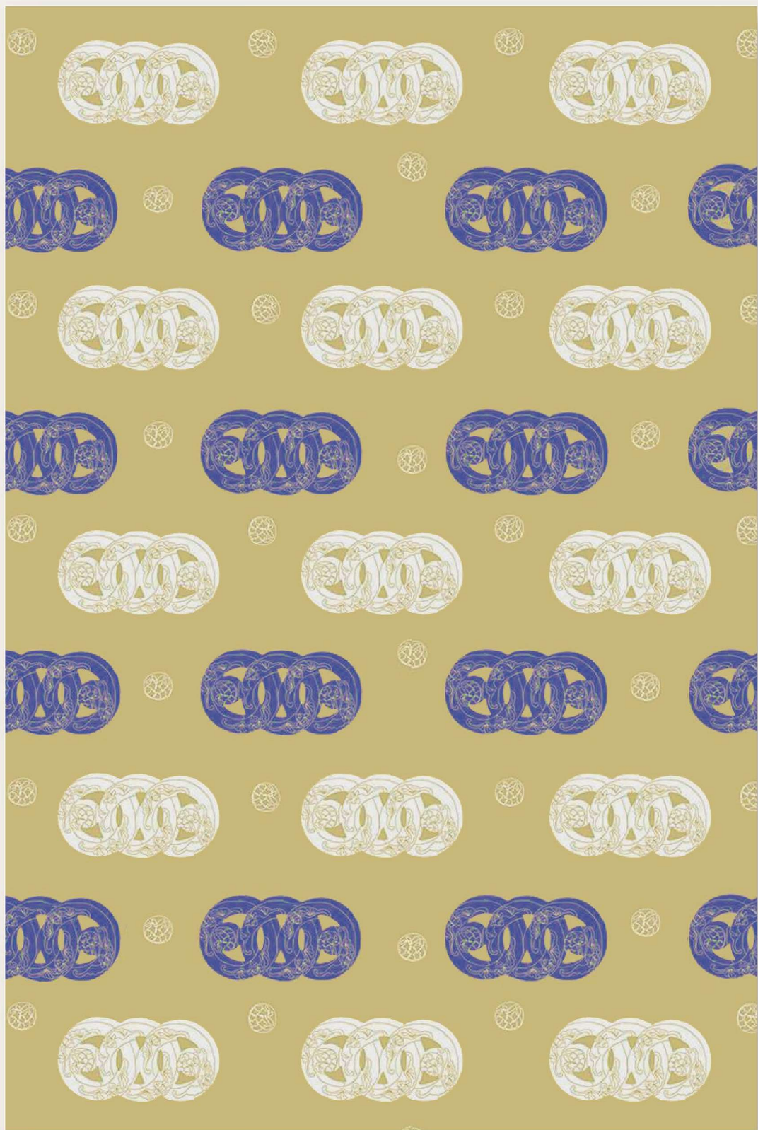
館藏圖像《銅胎掐絲琺瑯帶首》( 館藏編號 90-00099 )

此紋樣以典藏品環環相扣的形式為主要圖案的靈感來源，藏品紋飾重繪轉換成細膩線條，保留原本豐富及精美的工藝特色，並運用色彩變化，以及元素水平位移的交錯排列，平穩的構圖相應著藏品對稱的輪廓營造清爽質感