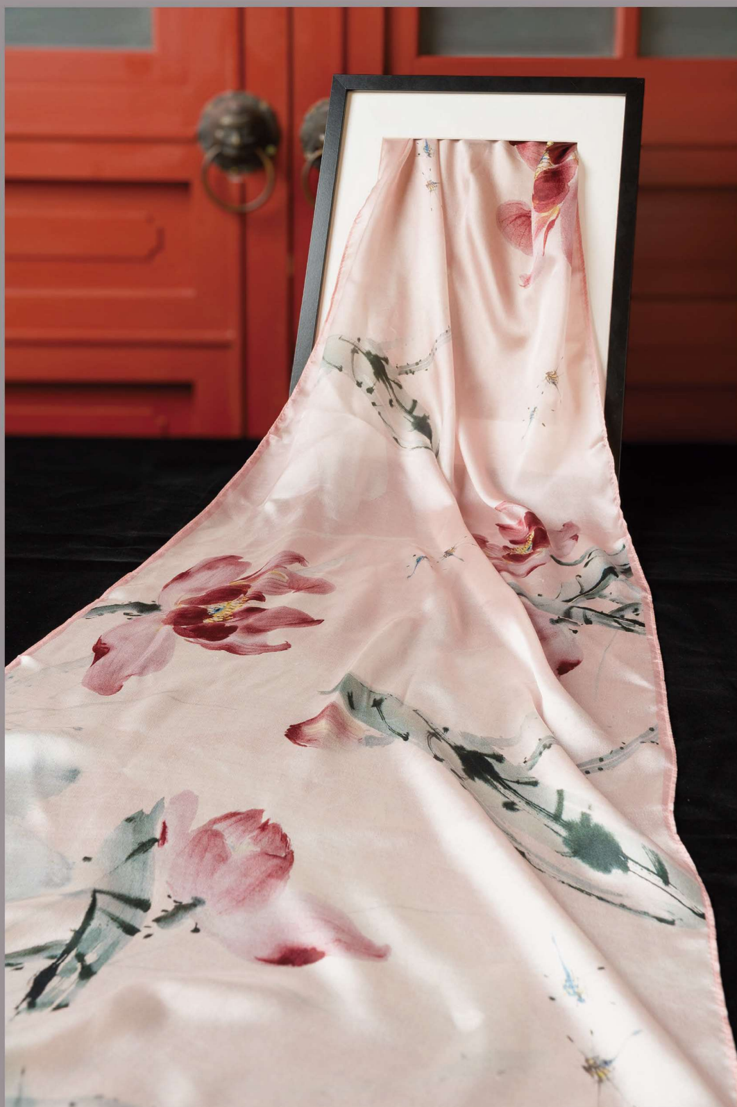
黃磊生荷花蜻蜓 共舞絲巾（粉）