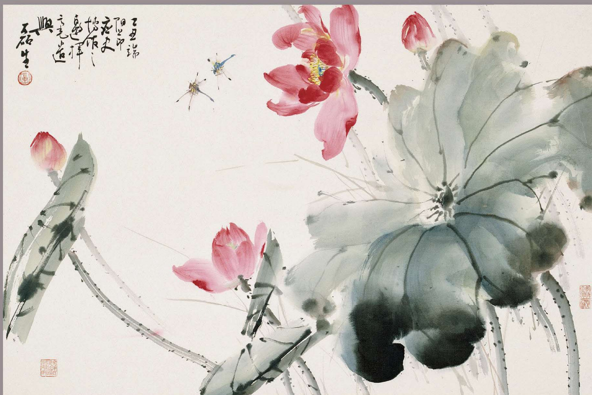
黃磊生《荷花》（館藏編號74-00824）

多位畫家於七十四年端午節蒞臨國立歷史博物館現場揮毫，畫家黃磊生畫《荷花》乙幅，畫裡荷花漫開，蜻蜓飛舞，墨葉挺挺。是年端午是國曆1985年6月13日，已正是史博後院台北植物園荷花池中荷花盛開的好時節。款識：「乙丑端陽節即應史博館之邀揮毫遣興。磊生。」鈐印：「黃」、「結翰墨緣」。畫家黃磊生，1928年出生於廣東臺山。1949年拜當代宗師趙少昂門下，1957年榮獲亞洲第一屆青年畫展優異獎，蜚聲國際。