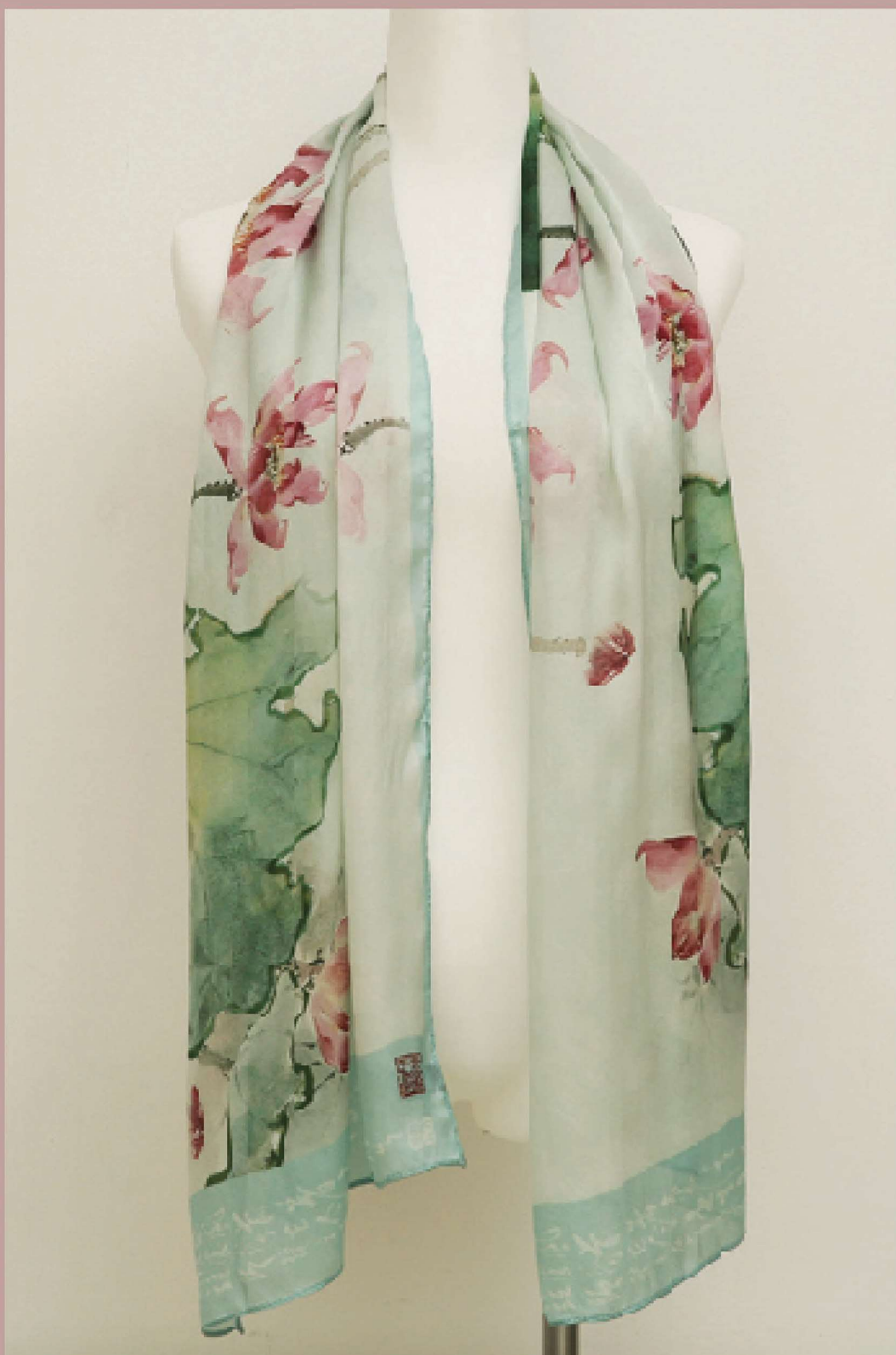
黃磊生荷花 寫意絲巾（綠）